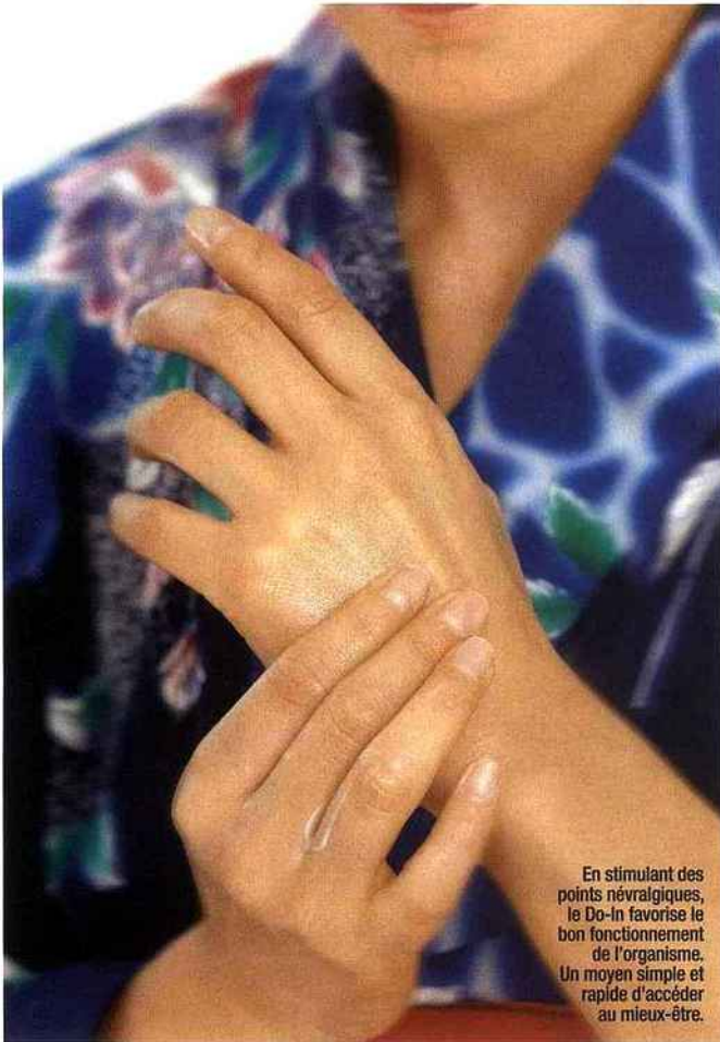
En stimulant des points névralgiques, le Do-In favorise le bon fonctionnement de l'organisme. Un moyen simple et rapide d'accéder au mieux-être.